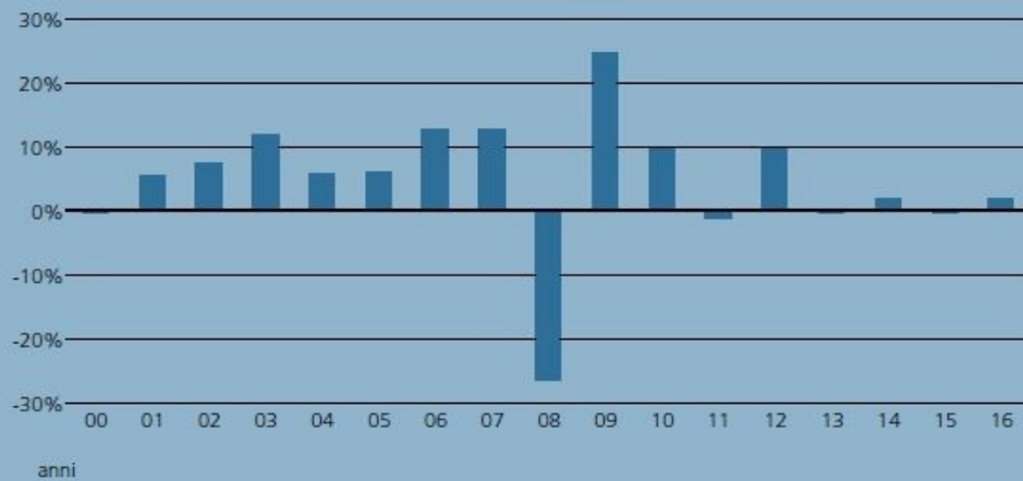
Performance annua ante imposte